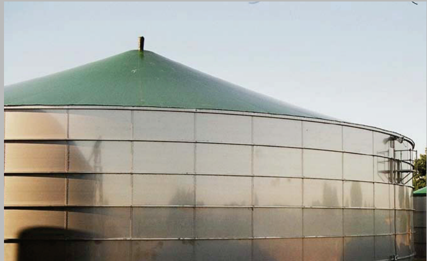
Behälteransicht außen mit Foliendach Tank outside with foil roof