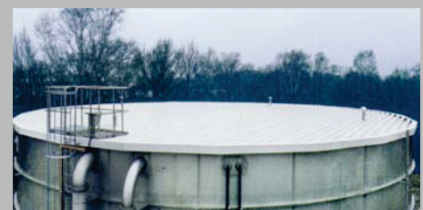
Ausführung Flachdach Achievement flat roof