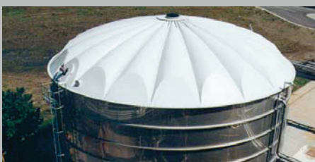
Ausführung Rippenkuppel Achievement rippled cupola