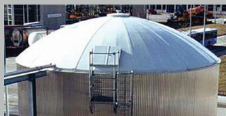
Ausführung Glattkuppel Achievement plain cupola