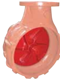
Das robuste Lauftrad

ECKART Turbo-Schleudertankwagen – im Aufbau gleich wie ECKART Pumpentankwagen – sind mit robusten und standfesten Kreiselpumpen ausgestattet. Die Gülle, die der Kreiselpumpe frei zufließt, wird über die Druckleitung mit hohem Druck an den Verteiler gefördert. Die Gülle wird durch Umlaufströmung gerührt, wodurch im Fassinneren keine mechanischen, hoch beanspruchten Teile erforderlich sind.